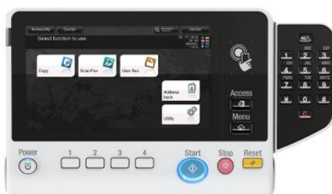
Ecran tactile couleur 7" Multi-touch avec zone d'authentification NFC et clavier (KP-101) optionnel