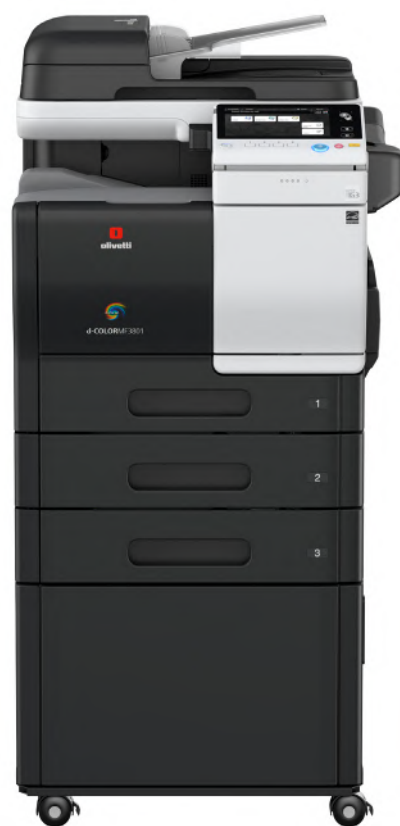
Configuration avec 2 magasins papier optionnels et meuble support