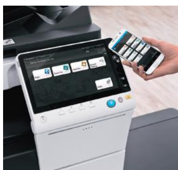
Nouvel écran tactile 10,1 pouces avec zone d'authentification NFC