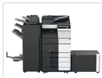
Configuration avec Module de finition FS-537SD, Inserteur hors four PI-507, Pont RU-513, Magasin papier PC-215, Magasin grande capacité LU-207