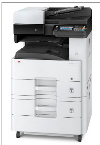
d-Copia 255MF avec magasin optionnel PF-470 et meuble bas