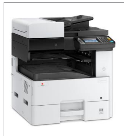
d-Copia 255MF sans options